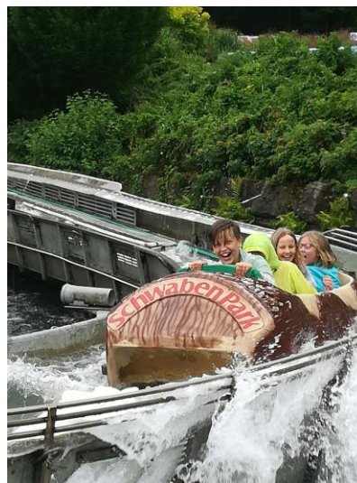
So schön kann Ferienprogramm sein.

Liebe Verantwortliche fürs Ferienprogramm,